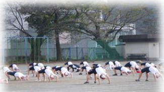
6年生の表現の練習風景

一学期がスタートして二週間が過ぎました。朝晩が冷え込み、起きるのがつらい今日この頃ですが、毎日、校内やグラウンドには子どもたちの元気な声が響いています。さて、十月二十九日(土)に令和四年度スポーツフェスティバルを開催します。感染防止対策のもと、一、三、六年生と二、四、五年生の二部制で行います。この行事を通して、各学年は、表現、競技の種目等に精一杯挑むとともに、異学年との交流を深めたり、上級生としての意識を高めたりすることを目指します。今年度のスローガンは、児童会が中心となって、複数の候補から五、六年生にアンケートを行った結果、右のとおりに決定しました。練習を積み重ねてきた自信と意欲に満ちた、笑顔いっぱいの子どもの活躍を楽しみにしています。また、児童進行の開会式・閉会式や各委員会による準備、片付け、他学年の支援など、子どもたちの主体性や自主性を育む機会にしていきたいと思っています。