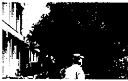
～暑さの中で、汗をかきながら～

今年度も、子どもたちのために安全で気持ちのよい学校にして いきたいという願いから、『南足柄小学校愛校会』の皆さんと保護 者の方々が、5月18日に除草作業を行って下さいました。愛校会 の皆さんは、本校の学区にお住まいの地域ボランティアの方たち です。南小の卒業生でもある先輩方も多くいられます。学校を盛 り上げ、応援して下さいている地域と保護者の皆さんの温かさを 感じた一日でした。約6年続いてこの活動は、今回で十回目 となります。各担任から学級の子どもたち には、この除草作業について、事 前に伝えました。「ありがとうご ざいます。」の子どもたちの声に、 「嬉しい言葉だね。」と、参加さ れた人からの笑顔のつぶやきが聞 かれました。学校をきれいにし て下さる地域や保護者の方々への感謝の気持ちを これからも大切に育てていきたいと思ひます。