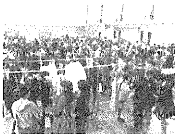
開会直後のにぎやかな会場