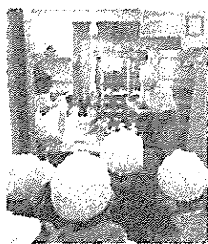
まちたんけん ~2年生~ パンデオーロさんで、パン作りの様子を真剣に見る子どもたち。