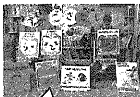
図書室の「かさとしさんコーナー」読み継がれている名作揃いです。

まちこみメールは、災害時他、必要に応じて活用していきます。今後、登録がまだの方に、個別にお知らせする予定です。ご協力よろしくお願いいたします。 *不明な点は、教頭までお問い合わせください。