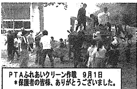
PTAふれあいクリーン作戦 9月1日 *保護者の皆様、ありがとうございました。