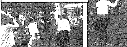
南小愛校会 9月6日 *46名の会員のうち、30名程の方が参加してくださいました。