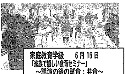
家庭教育学級 6月16日 「家族で嬉しい食育セミナー」 ～講演の後の試食：共食～

登下校中に大きな地震が起きた時 ■ブロック塀、門柱など、倒れやすいものから離れ、しゃがんで頭を守ります。 ■地震がおさまったら、自宅か学校に行きます。(近い方) *ご家庭でも、お子さんと確認してください。